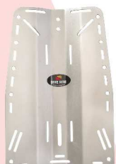
ステンレスプレート