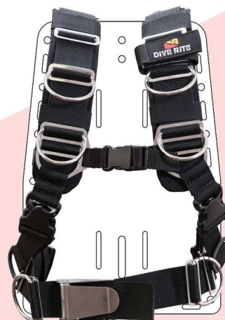
ステンレスライトプレート