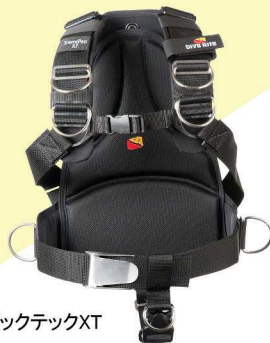
トランスパックテックXT